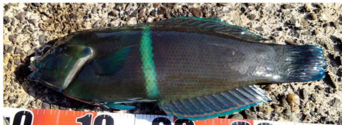
カンムリベラ美味しかった!